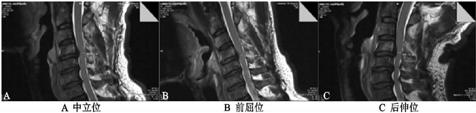
图 3 不同体位 MRI 测量

纳入研究的患者共 60 例;其中男 13 例,女 47 例;年龄 45~75 岁,平均(57.43±5.89)岁。临床表现大多为颈肩痛、上肢麻木疼痛等。治疗前疼痛评分(VAS)为(3.56±1.24)分,颈椎功能障碍指数(NDI)评分为(30.86±6.00)分。60 例患者全部完成多体位 MR 检查和 10 d 治疗,其中 2 位患者在后伸位 MR 检