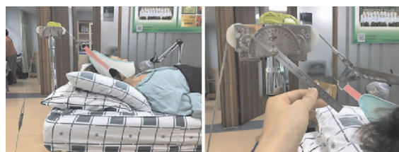
图1 仰卧前屈拔伸牵引法治疗示意

1.6.1.1 牵引角度: 患者取仰卧位,操作者立于患者头侧,一手用虎口及手掌固定患者枕后,另一手小鱼际固定患者下巴,通过两手的配合发力,对颈椎进行手法牵引。先取中立位牵引,然后逐渐提拉增加前屈角度,边牵引边询问患者疼痛等症状的变化,症状减轻甚至消失时的角度即为有效牵引角度,角度范围一般为前屈20°~45°,测量牵引角度并记录。